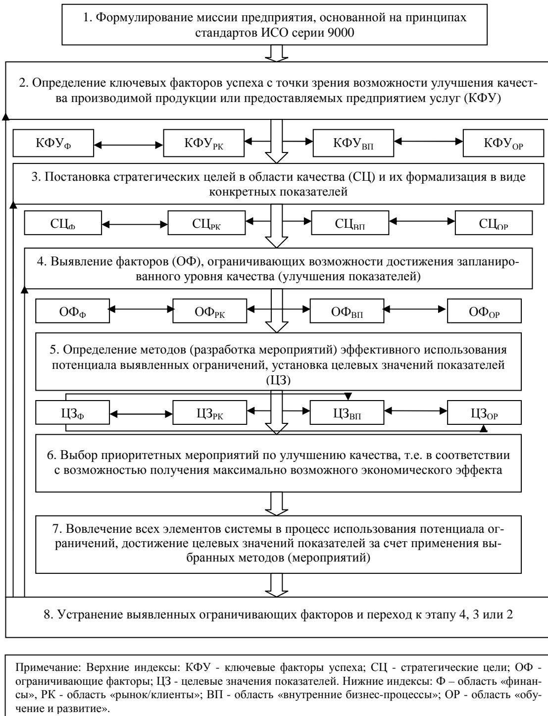
РИСУНОК 2. СХЕМА РАСШИРЕННОГО ПРОЦЕССА НЕПРЕРЫВНОГО УЛУЧШЕНИЯ